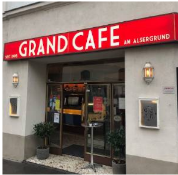
Take-away bietet das „Grand Café am Alsergrund“ nun auch.

sich auf die Zeit, in der seine Gäste den Kaffee auch wieder vor Ort genießen können. Sobald das Wetter wärmer werde und die Schanigarten-Saison starte, werde es so weit sein, glaubt er. Und auch andere Alsergrunder Geschäftsleute lassen sich nicht unterkriegen und arbeiten in dieser schwierigen Zeit an neuen Angeboten oder Vertriebswegen. Einen Überblick über die Aktivi-