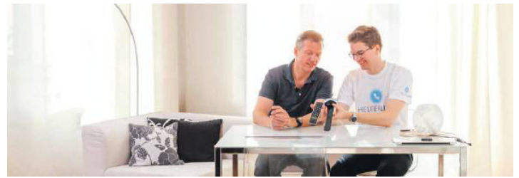
Wer keinen Hausbesuch möchte, kann auch in den Helferline Reparatur-Shop auf der Josefstädter Straße 25 kommen.

Kaffeeliebhaber aufgepasst: Das el café, Röstatelier & Café, in der Alserbachstraße 3 sucht nämlich Verstärkung im Rahmen von 20 Stunden pro Woche. Dazu findet am Dienstag, 28. Juni, um 18 Uhr eine „Bewerber-Röstparty“ statt. Wer keine Zeit hat, schickt eine Mail: othmar.mueller@elcafe.at WERBUNG