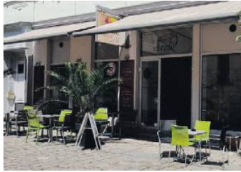
Das el café in der Alserbachstraße sucht Verstärkung.

Kaffeeliebhaber aufgepasst: Das el café, Röstatelier & Café, in der Alserbachstraße 3 sucht nämlich Verstärkung im Rahmen von 20 Stunden pro Woche. Dazu findet am Dienstag, 28. Juni, um 18 Uhr eine „Bewerber-Röstparty“ statt. Wer keine Zeit hat, schickt eine Mail: othmar.mueller@elcafe.at WERBUNG