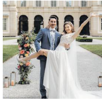
Brautmoden-Shooting vom Wiener Hochzeitsbuch.

Im Rahmen der Vorbereitungen für das zweite Wiener Hochzeitsbuch fand ein Brautpaar-Shooting in herrschaftlicher Atmosphäre im Palais Liechtenstein statt. Die Braut wurde von Julia Lara in der Brautkleid Meisterwerkstatt und der Bräutigam von Grandits Hochzeitsmode ausgestattet. Beides renommierte Betriebe aus dem 9. Bezirk! Und echte Spezialisten am Alsergrund noch dazu. WERBUNG