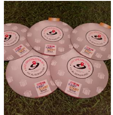
So sieht die „Weihnachtskugel“ der Spezialisten aus.

Weihnachtskugeln gibt es am Alsergrund nicht nur am Christbaum, sondern auch in gedruckter Form. Gemeint ist damit die „Weihnachtskugel“ der Spezialisten am Alsergrund, die jedes Jahr in der Vorweihnachtszeit verteilt wird. Dabei handelt es sich um eine praktische Broschüre, in der viele Angebote und Rabatte bei Alsergrunder Betrieben zu finden sind – kompakt gesammelt und übersichtlich aufbereitet.