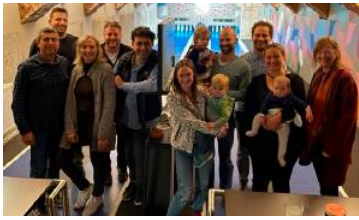
Die Spezialisten kegeln regelmäßig im Grand Café.